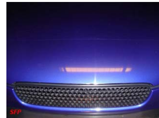
Na 72 uur uitharding