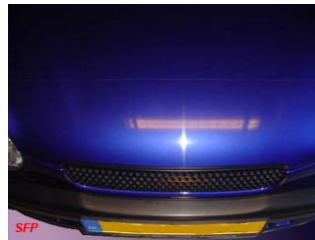
Na 48 uur uitharding